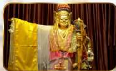
เทพทันใจโจ้เข้า