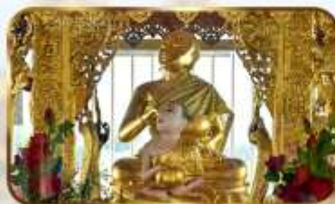
ขอพระพระอุปคุต ปางจกบาตเรียมมาร