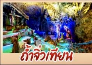
ถ้ำจิวเทียน