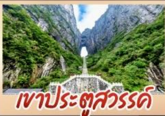
เขาประตูล้ำวรรค