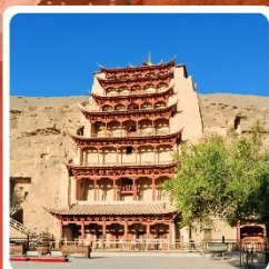
กำมั่วเกาตุ