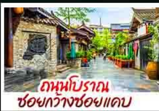
ถานบิราณเซอชวงกวางชอยแคบ