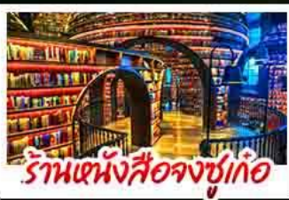
ร้านหนังสือจุงชู่เกอ