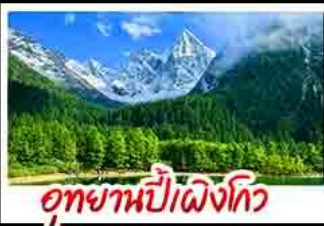
อุทยานบี๋เผิงโกว

อุทยานสัตว์ดุณี - อุทยานบี๋เผิงโกว - เมืองตูเจียงช่งช่น - รูปปั้นเขมมาพันล้านอนเชคพี ร้านหนังสือจุงชู่เกอ - ล่องเรือชมเขาวงพ้อโตเล่อซาน - ถานบิราณเซอชวงกวางชอยแคบ - วัดต้าซือ ถนนคนเดินซันซี้ลู่ - เขมมาพันล้านปีนตึกIFS - ถานนันทู่กุเอี - ชมแสงสีน้ำพุ่มไม้ไฟตึก SKP - ชมตึกแฝดเจิงตุ