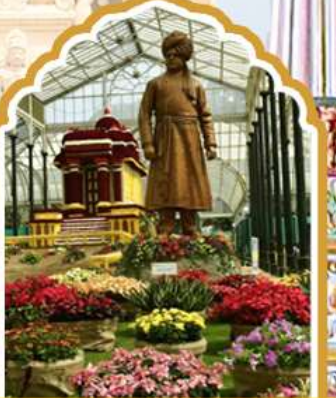
บังกาลอร์