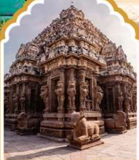
กาญจีปุรัม