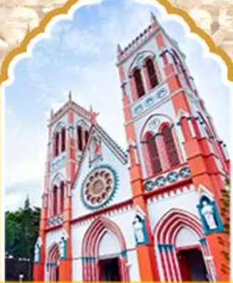
ปอนตีเชอร์