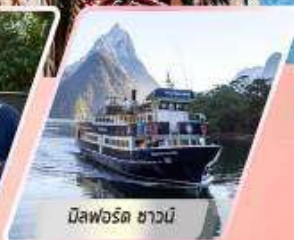
มิลฟอร์ด ซาวน์