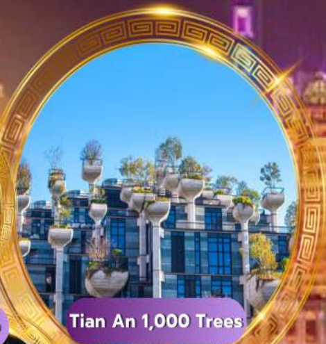
Tian An 1,000 Trees