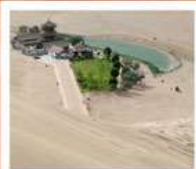
เขื่อนทรายหมิงซาซาน