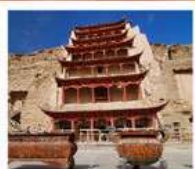
ถ้ำม่อเกาตุ