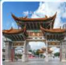
ประตูปากงอกโกหยก