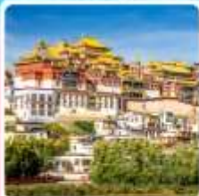
วัดลามะซงจ้านหลิน