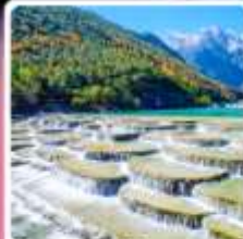
ทะเลสาบโป้ซู่หยง