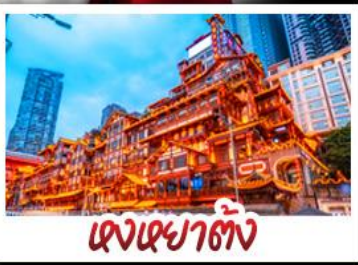
แองแองตัง