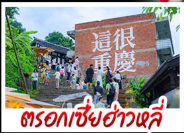
ตรอกซี้ยฮ่าวหลี่