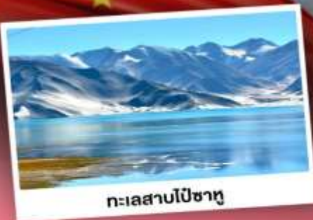
ทะเลสาบโปซาทุ

เปิดประตูสู่อารยธรรมพันปีแห่งซินเจียงใต้ ชมความสวยงามของหมู่บ้านดอกแอปเปิ้ล