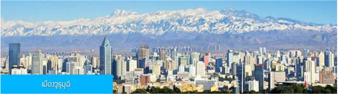
เมืองูรูมูฉี