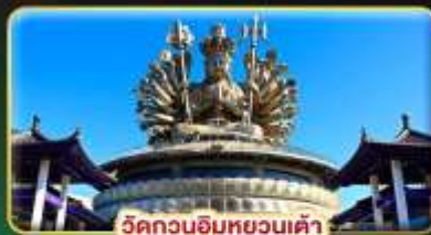
วัดกวนอิมหยวนเต้า