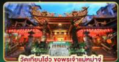
วัดเทียนโถ้ว ขงพรเจ้าแม่หน่าจู้