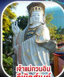
เจ้าแม่กวนอิม รีพัสลีย์