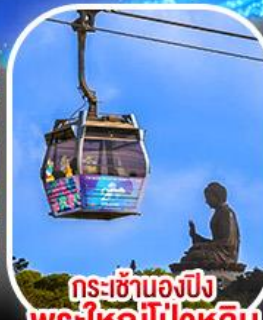
กระเช้าเองปีง พระใหญ่โป่วหลิน