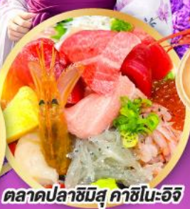
ตลาดปลาชิบิสึ คาชิโนะอิจิ