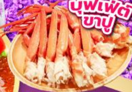
บุฟเฟ่ต์ ชาบู