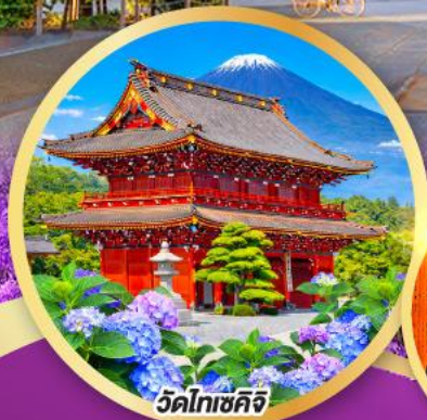
วัดโทเซคิจิ