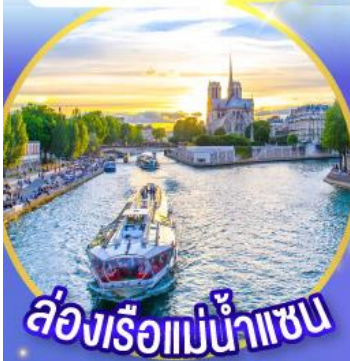
ล่องเรือแม่น้ำแอม