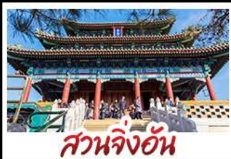
สวนจิ่งอัน