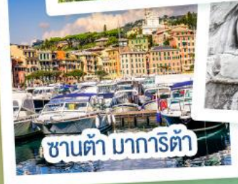
ซานต้า มารีต้า