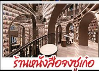
ร้านหนังสือจุงซูเก้อ