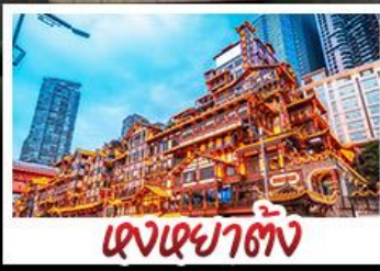
แดงเขย่าตั้ง