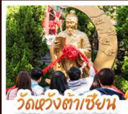
วัดเข่งต้าซิงหน