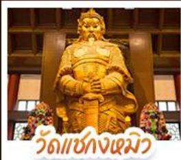
วัดเชกงไฉมว