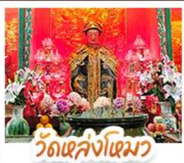
วัดเส่งไฉมว

นั่งรถรางพิกัดแตรมสู่ TOP OF PEAK • ช้อปปิ้งจุใจมก และ CITYGATE OUTLAETS • นั่งกระเช้ามองปิง สักการะพระใหญ่เทียนถาน • จอพรเจ้าแม่หล่งโหมว แมอง 5 มังกร ให้ประสบความสำเร็จในทุกๆ ด้าน