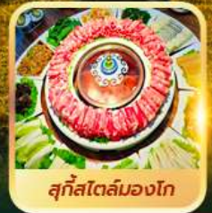
สุกีสโตลมองโก