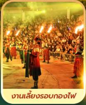
งานเลี้ยงรอบกองไฟ