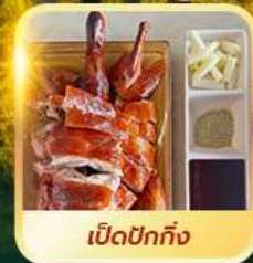
เบ็ดปักกิ้ง