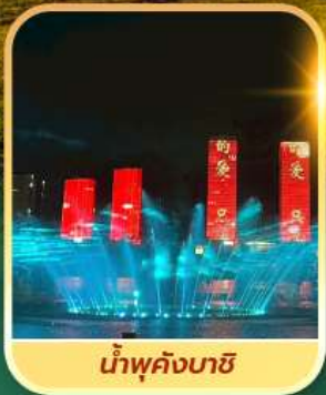
น้ำพุคังบาซี