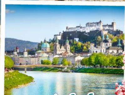
ซาลซ์บวร์ก