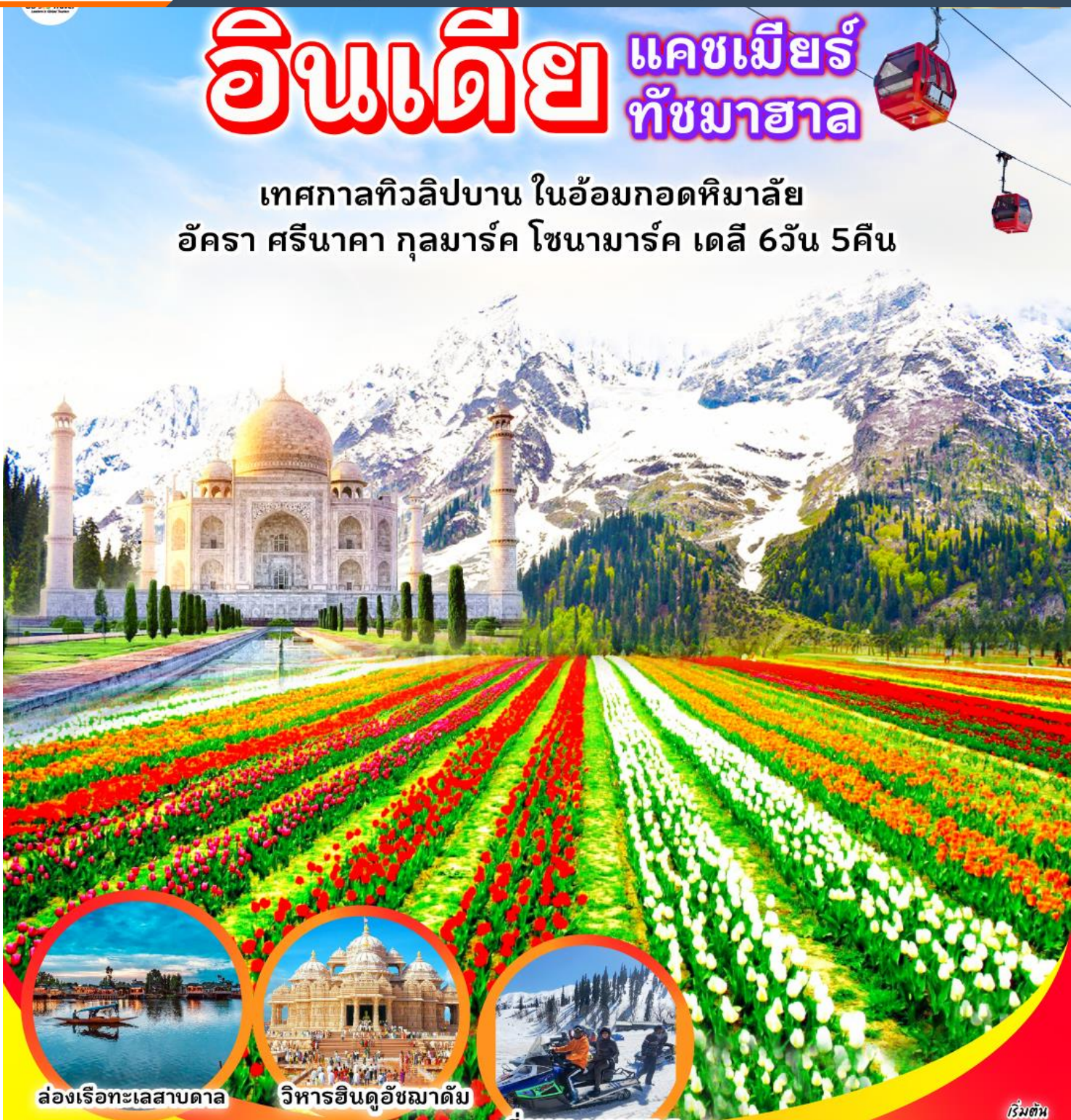
ล่องเรือทะเลสาบดาล

เทศกาลทิวลิปบาน ในอ้อมกอดหิมาล้ำ อัครา ศรีนาคา กุลมาร์ค โซนามาร์ค เดลี 6วัน 5คืน