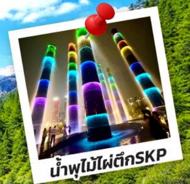
น้ำพุไม้ไฟตึกSKP

อุทยานปี้ฝิงโกว อุทยานจิวจ้ายโกว 6วัน 5คืน