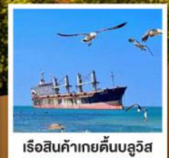
เรือสินค้าเกย์ตันบลูวิส