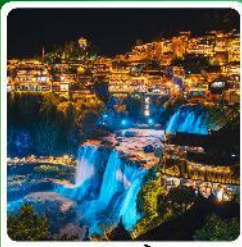
ฟูรงเจิน