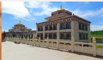
ทำเนียบพระลามะอุหลาน