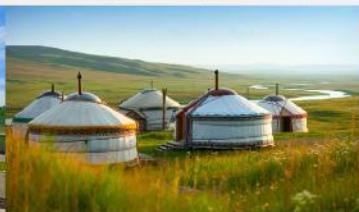
กู่งหว้าออร์ดอส