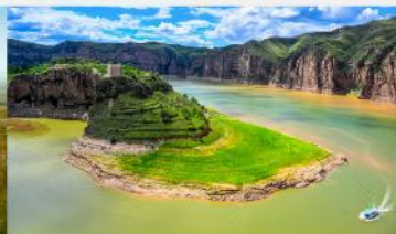
แกรนด์แคนยอนแม่น้ำเหลือง

*ทางบริษัทฯ ขอสงวนสิทธิ์ในการสลับโปรแกรมทัวร์ตามความเหมาะสมขึ้นอยู่กับสถานการณ์หน้างาน โดยคำนึงถึงผลประโยชน์ของลูกค้าเป็นสำคัญ