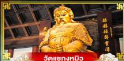
วัดเข่งทมิฬ