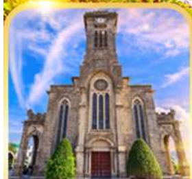
โบสถ์หินญาจาง