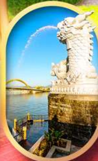
คาร์พดราท้อน