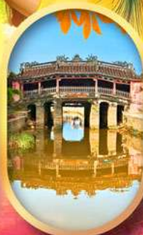
เมืองเก่าฮอยอัน