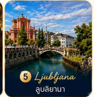
5 Ljubljana ลูบลียานา