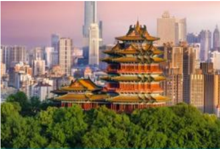
นครนานกิง