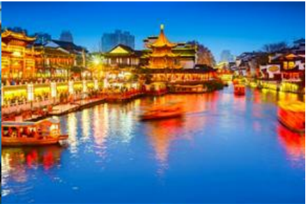
ย่านฟูจื่อเมี่ยว