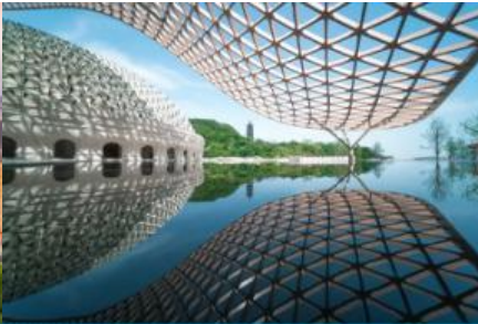
อุทยานกุ่มกึ่งยวหนิวโล่วซาน