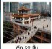
ตึก 22 ชั้น