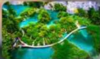
อุทยานแห่งชาติพลีทวิเช่