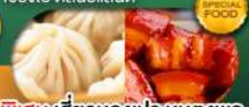
พิเศษ เสี่ยวหลงเป่า หมูคังพอ เดินทาง ม.ค. - มิ.ย. 69