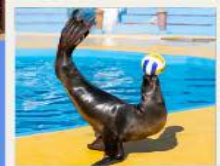
POLAR OCEAN PARK