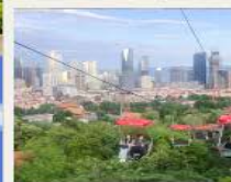
กระเช้าชมเมือง