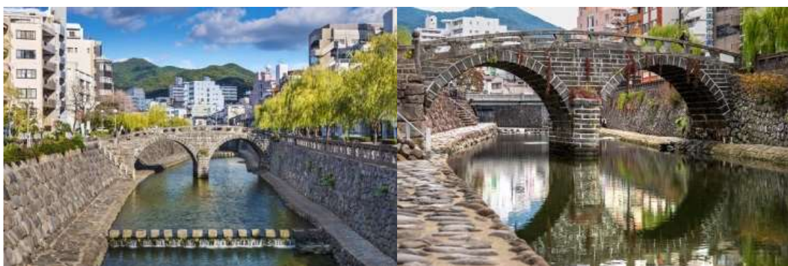
สะพานเมกาเนบาชิ (Meganebashi Bridge)

นากาซากิ (Nagasaki) เป็นเมืองที่ตั้งอยู่ทางตะวันตกของเกาะคิวชู ประเทศญี่ปุ่น เมืองนี้เป็นที่รู้จักจากประวัติศาสตร์อันยาวนานและวัฒนธรรมที่หลากหลาย เมืองนี้เป็นที่รู้จักจากชายหาดที่สวยงาม อาหารทะเลสด และสถานที่ท่องเที่ยวทางประวัติศาสตร์และวัฒนธรรมมากมาย