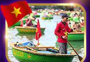
เรือกระด้ง หมู่บ้านก๊อบกาน