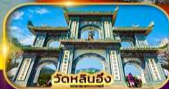
วัดหลันฮั่ง