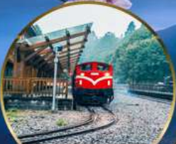
อุทยานอาลีซาน