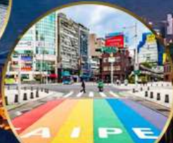
ตลาดซีเหมินติง