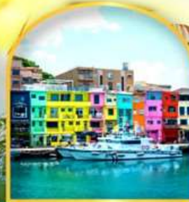
หมู่บ้านประมงหลากสี