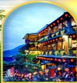
หมู่บ้านโบราณจี๋วเฟิ่น