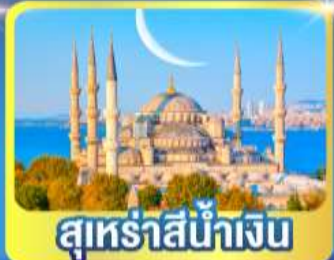
สุเหร่าสีน้ำเงิน