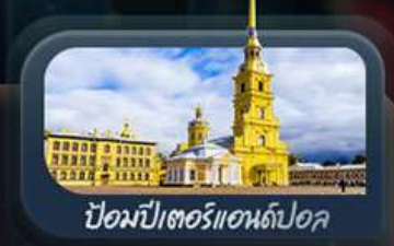
ป้อมปีเตอร์แอนด์ปอล