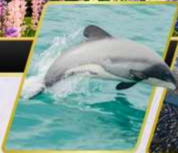
ล่องเรือชมปลาโลมา