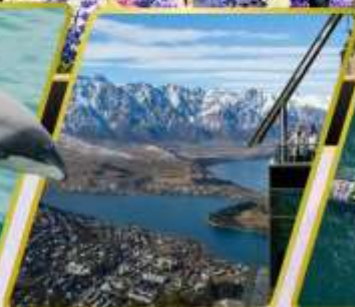
ยอดเขาม็อบส์พิค