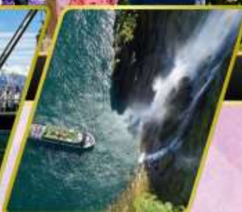
ล่องเรือมิลาฟอร์ด ชาวน์