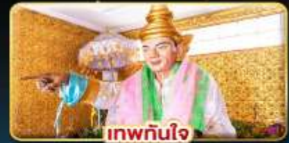
เทพกษัใจ