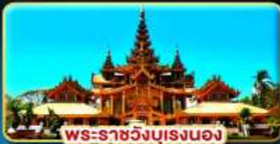
พระราชวังบุเรงนอง