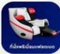
ที่นั่งพนักมือบนเฟลทเบด