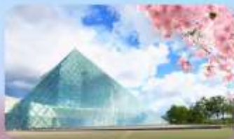
Glass Pyramid "HIDAMARI"