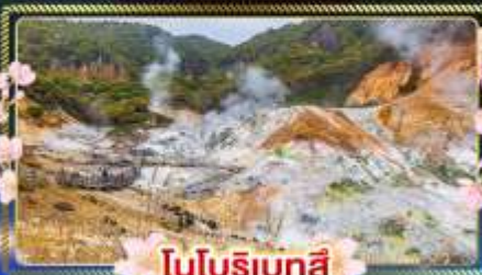
โนบุริเบตสึ

เที่ยวครบไฮไลท์ฮอกไกโดได้ ในช่วงที่สดชื่นที่สุดของปี