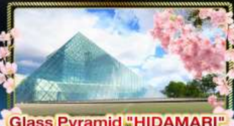
Glass Pyramid "HIDAMARI"