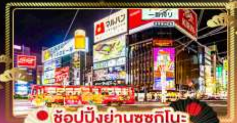
• ช้อปปิ้งย่านซุกุชิโนะ