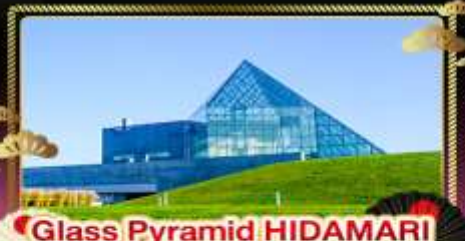
• Glass Pyramid HIDAMARI