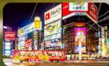
ซุปป์ิงย่านซูซุกิโนะ