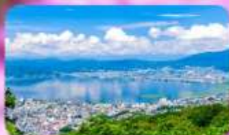
ทะเลสาบสุวะ