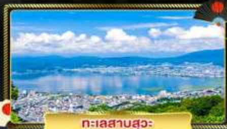
ทะเลสาบสุวะ