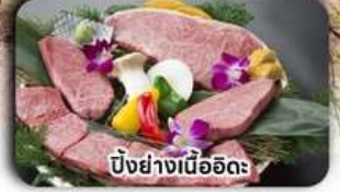
บิงย่างเนื้ออิดะ