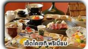
เซตโคเชกิ พรีเมียม