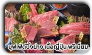
บุฟเฟ่ต์บิงย่าง เนื้อญี่ปุ่น พรีเมียม